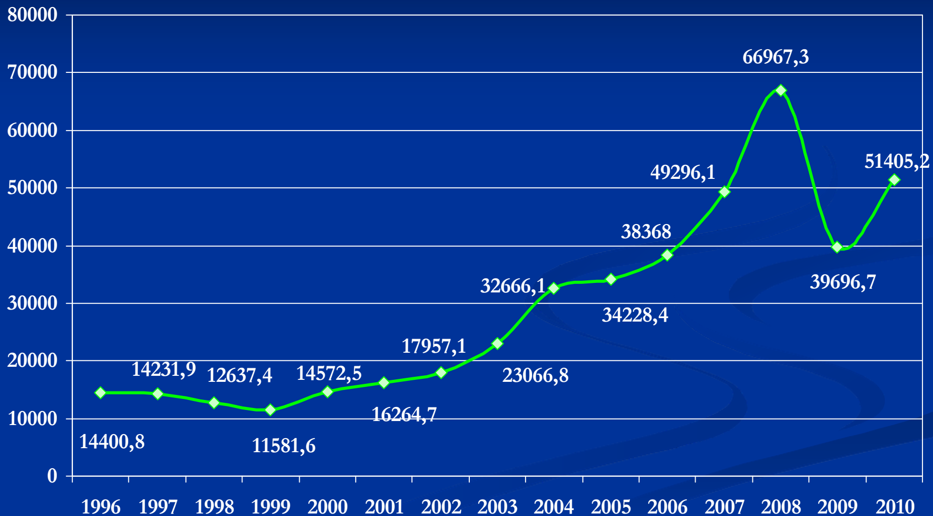
Рис. 1 - Динаміка експорту товарів за період з 1996 по 2010 роки , млн. дол.